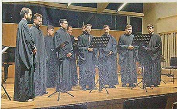
Ο βυζαντινός χορός «Εν Ψαλμοίς», που θα εμφανιστεί στον «Παρνασό» τη Δευτέρα 27 Νοεμβρίου.