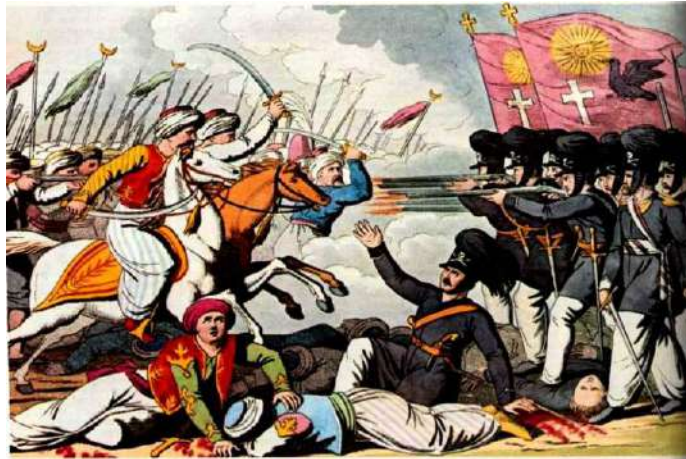
Οι Ιερολοχίτες μάχονται στο Δραγατσάνι

Η μάχη του Δραγατσανίου, που διεξήχθη τον Ιούνιο του 1821, αποτελεί ένα από τα πλέον εμβληματικά και συνάμα τραγικά επεισόδια της Ελληνικής Επανάστασης. Η σημασία της δεν έγκειται στη στρατιωτική της έκβαση, η οποία υπήρξε καταστροφική για τις επαναστατικές δυνάμεις, αλλά στον ιστορικό και συμβολικό της χαρακτήρα. Υπήρξε η πρώτη ουσιαστική αναμέτρηση των Ελλήνων επαναστατών με οργανωμένα οθωμανικά στρατεύματα και ανέδειξε με ωμό τρόπο τα όρια των σχεδιασμών της Φιλικής Εταιρείας.